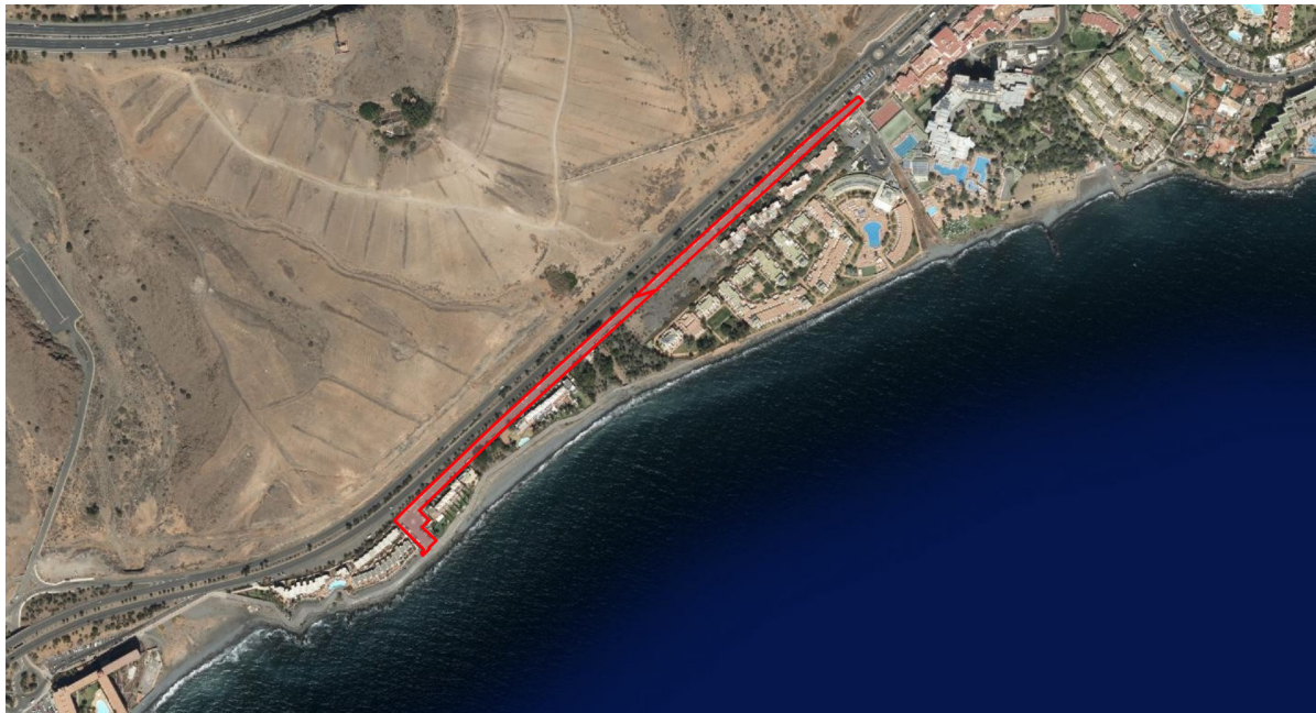
Gráfico de las zonas afectadas:

Se solicita la activa colaboración de la ciudadanía para de este modo minimizar aquellos problemas que se puedan ocasionar en la vía y en el tráfico rodado provocados por la actividad específica, y por lo tanto se recomienda, que estacionen sus vehículos en espacios diferentes a las vías especificadas en el documento, y especialmente, el acatamiento de las instrucciones, señalización e indicaciones de los agentes de la Policía Local y operarios de las obras destinados a tal efecto.